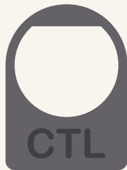
Etiqueta em Policarbonato Texturizado

Etiquetas ou Placas em Braille para sinalização de ambientes comerciais e elevadores de passageiros em Aço Inóx ou em Policarbonato Texturizado de acordo com as normas NBR . Fabricação em alto ou baixo-relevo de acordo com as especificações técnicas.